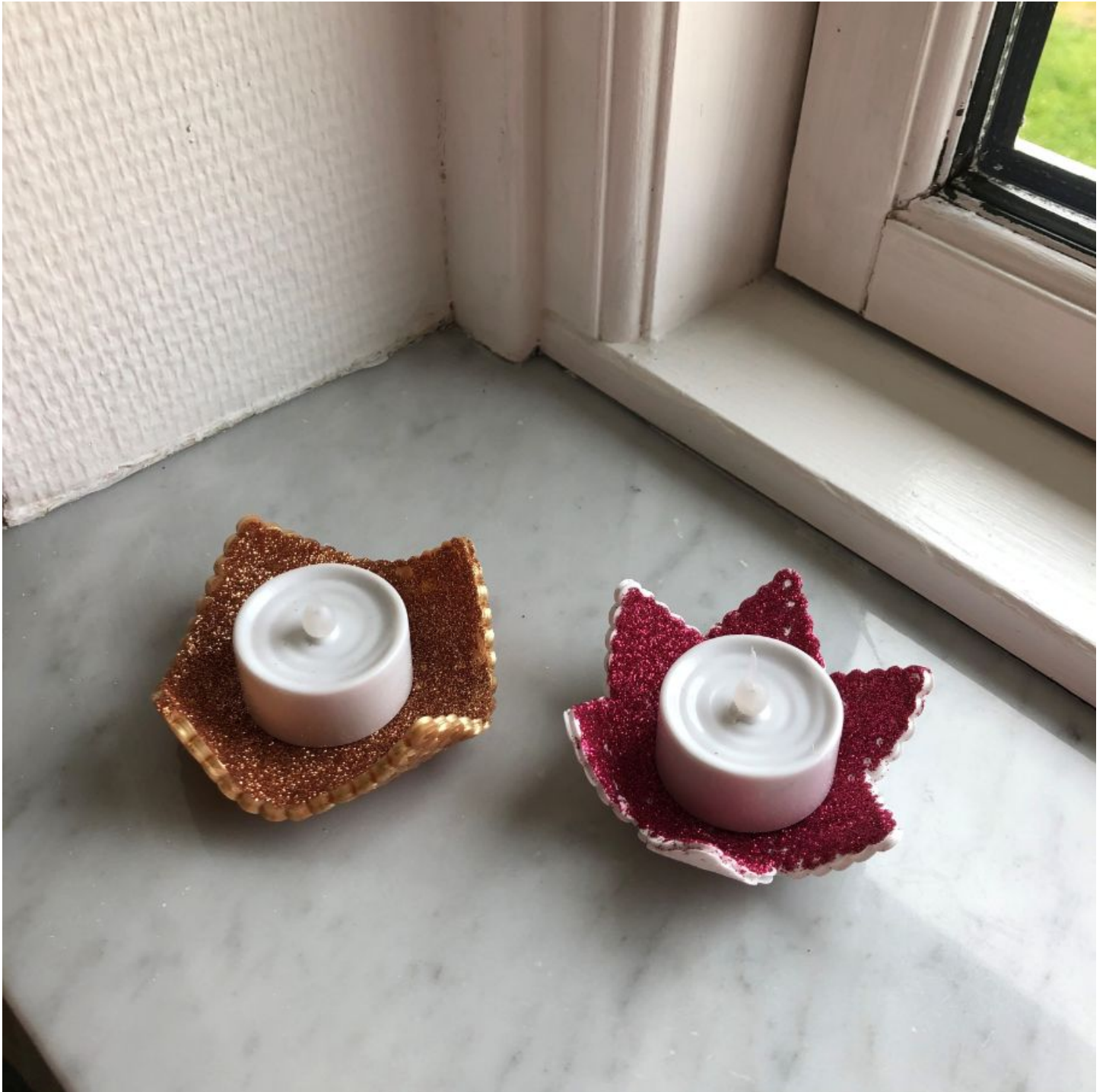
Designet av: Kreatosse (Majken Andreasen)